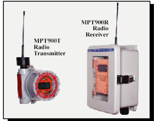
Radio Transmisor Inalámbrico (MPT900T) y Radio Receptor Inalámbrico (MPT900R)

El Sistema de Telemetría Inalámbrica de Mil-Ram es Multi-Procesos en el que cualquier transmisor/transductor de 2-, 3- o 4-hilos instalado en el campo ( temperatura, presión, humedad, flujo, pH, conductividad, etc. ) que genere una señal de 4-20mA puede ser equipado con un radio transmisor y la data continuamente es enviada al sistema de control vía comunicación inalámbrica. Los radio transmisores/receptores utilizan técnicas de reconocimiento de data avanzada para asegurar la confiabilidad e integridad de la data; data corrupta es automáticamente rechazada. Los radio transmisores/receptores tienen una pantalla LCD para fácil configuración el cual simplemente involucra seleccionar le dirección específica para cada transmisor 4-20mA instalado en el campo. La dirección provee una identificación única para cada transmisor 4-20mA para eliminar interferencias por cruces con otros dispositivos.